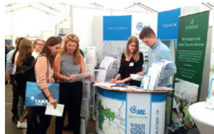
Unternehmen werben am Stand der Region @see

Traditionell wird die Stadt Fürstenwalde/Spree auch in diesem Jahr als Aussteller an der Technischen Hochschule Wildau [FH] vertreten sein und für die Region @see bei der Firmenkontaktmesse werben. Die TH Wildau [FH] bietet Studenten